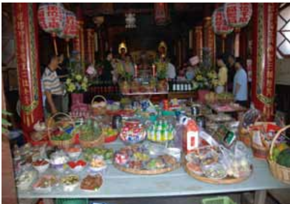
▲圖 16. 安平伍德宮水手會祭典

號永祀王船，在 1984 年建造完成時，神明指示準備招收總管一名、水手數名與相關工作人員 46 ，作為王船上的工作人員，以及負責後續祭祀工作。信徒（人）往生後，會正式入籍「籍簿」 47 ，跟隨王爺作為工作人員（神），並由家屬接續相關祭祀工作。另外信徒也可請示與稟明王爺，將自己往生的家屬入籍，作為神明的部屬。每年會選定蘇王聖誕前辦理「水手會」，由家屬準備祭品祭拜，並邀請附近妙壽宮內奉祀金萬安號王船上的水手一同前來享用。而在蘇王爺聖誕後，也會擇期為王船燒化添載。