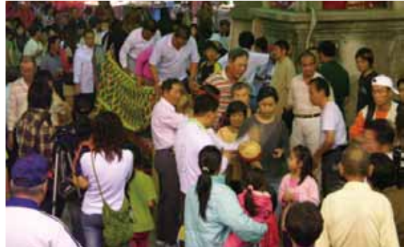
▲圖 27. 溪州代天府「過青刀巷」 Figure 27. “Passing the blue knife alley” conducted by Daitianfu, Xizhou.