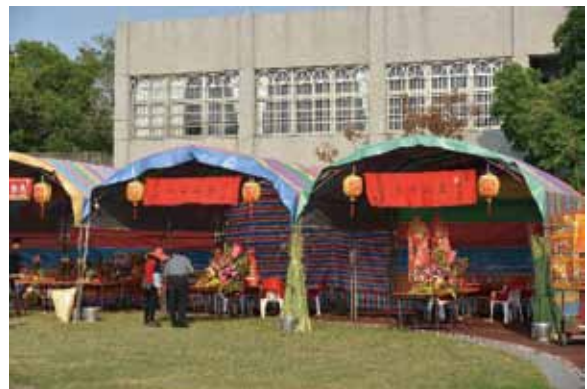
▲圖 10. 水上塗溝請南北巡（分設王座） Figure 10. Inviting the kings to patrol the south and the north conducted at Tugao, Shuishang (preparing the kings' seats).