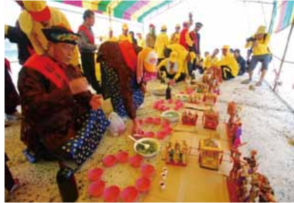
▲圖 38. 桶盤福海宮送王（宴轎夫） Figure 38. Bidding the kings farewell conducted by Fuhai Temple, Tongpan (feasting the sedan chair carrier).