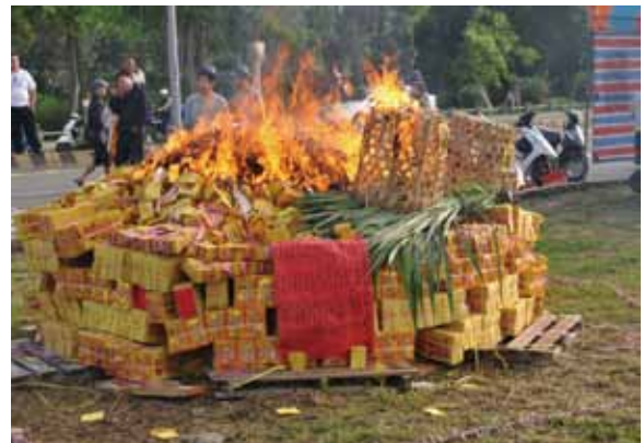
▲圖 17. 安平天龍壇「送柴米」

Figure 17. "Presenting firewood and rice" ceremony conducted by Tianlong Altar, Anping.