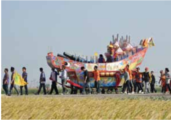
▲圖 35. 土庫新庄慶安宮送王

Figure 35. Bidding the kings farewell conducted by Qingan Temple, Xinzhuang, Tuku.