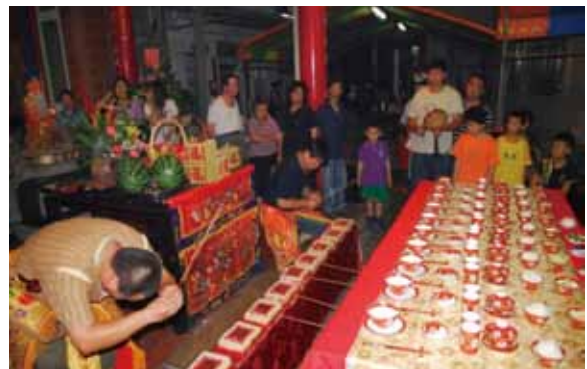
▲圖 34. 鹿港東興宮送春糧

Figure 34. Presenting foodstuffs in spring, conducted by Dongxing Temple, Lukang.