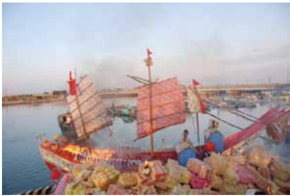
▲圖 2. 東石副瀨富安宮送王

本地區另有長期（12 年）才進行一次大型的迎王祭典，如布袋嘉應廟、新塹嘉應廟、龍江卿雲廟等廟 24 。另有逢五年王五年大科（4 年一次）會特別辦理迎送王儀式，如網寮鎮安宮，或是在固定