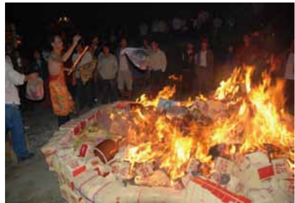
▲圖 21. 新營濟安宮送王 Figure 21. Bidding the kings farewell conducted by Jian Temple, Xinying.