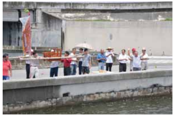
▲圖 3. 東石山寮由天宮請王

Figure 2. Bidding the kings farewell conducted by Fuan Temple, Dongshi.