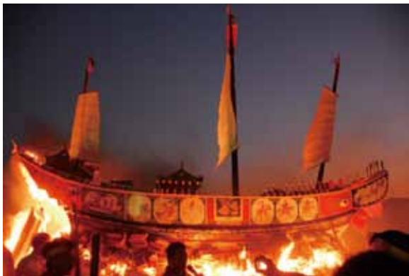
▲圖 12. 三寮灣東隆宮送王