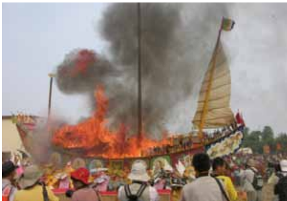
▲圖 20. 關廟山西宮送王 Figure 20. Bidding the kings farewell conducted by Shanxi Temple, Guanmiao.