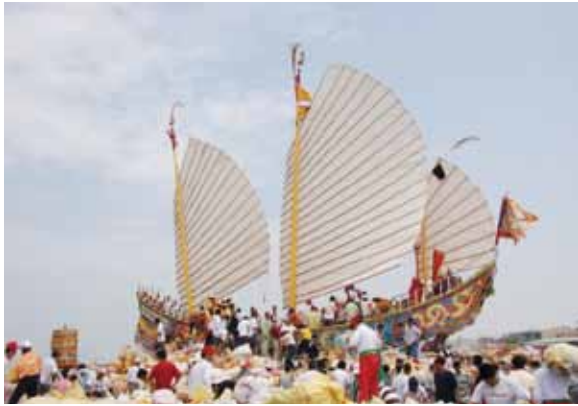
▲圖 22. 茄荳賜福宮送王

Figure 22. Bidding the kings farewell conducted by Cifu Temple, Jiading.