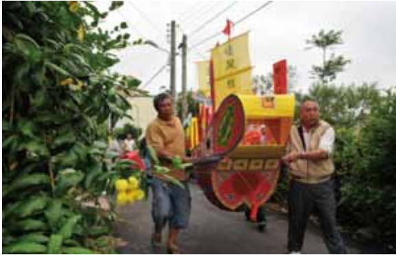
▲圖 30. 淡水忠義宮送王

Figure 30. Bidding the kings farewell conducted by Zhongyi Temple, Tamshui.