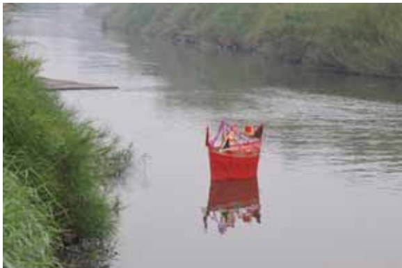
▲圖 7. 太保溪南福興宮送王 Figure 7. Bidding the kings farewell conducted by Fuxing Temple, Xinan, Taibao