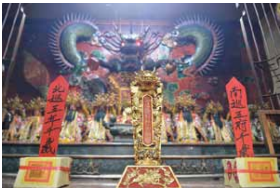
▲圖 9. 東石鰲鼓壽天宮南北巡（王令） Figure 9. Patrolling the south and the north conducted by Shoutian Temple, Aogu, Dongshi (Wang Ling – The King's Decree).