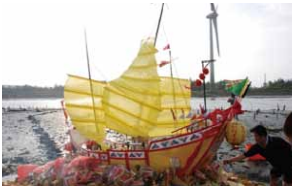
▲圖 33. 鹿港東興宮送春糧

馬鳴山鎮安宮為臺灣五年千歲的信仰中心，每逢「寅、午、戌」年，於 10 月 27、28、29 日舉辦三朝清醮，稱為「大科年」，雖為廟內王爺進興醮典，實仍為代天巡狩進行相關科儀，後續有專節討論，在此不多作敘述。雲嘉地區逢「寅、