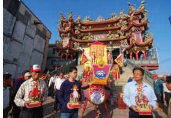
▲圖 36. 麥寮下橋頭鎮盛宮送王

Figure 36. Bidding the kings farewell conducted by Zhensheng Temple, Xiaqiaotou, Mialiao.