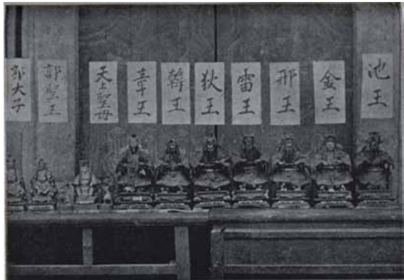
▲圖 32. 漂來王船上神明（1903）

Figure 32. The deities on the floating king's boat (1903).