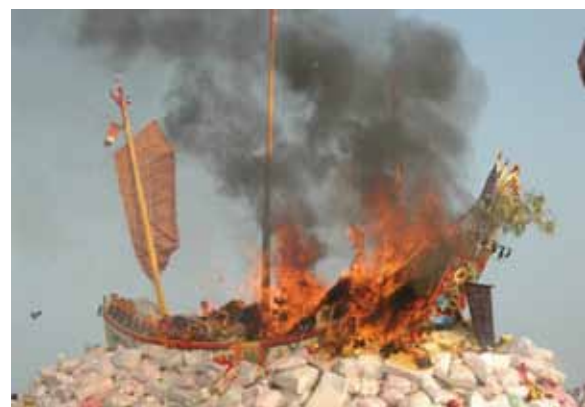
▲圖 19. 灣裡馬鎮宮送王