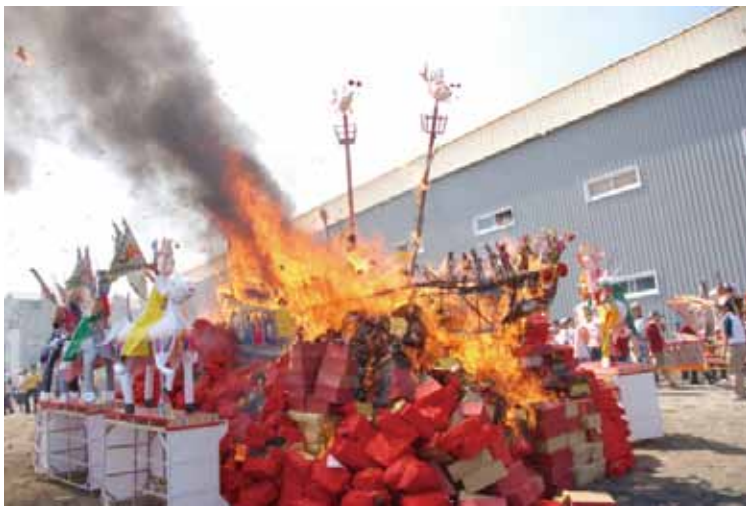
▲圖 14. 三老爺宮送王

Figure 14. Bidding the kings farewell conducted by Sanlaoye Temple.