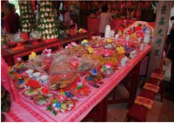
▲圖 39. 金門後浦頭慈德宮宴王

Figure 39. Bidding the kings farewell conducted by Fuhai Temple, Tongpan (feasting the sedan chair carrier).