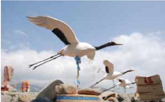
▲圖 26. 楓港德隆宮請王紙鶴 Figure 26. The origami cranes used to invite the kings made by Delong Temple, Fenggang.