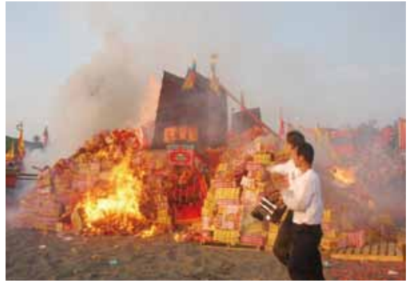
▲圖 25. 高雄臨水宮送王

Figure 25. Bidding the kings farewell conducted by Linshui Temple, Kaohsiung.