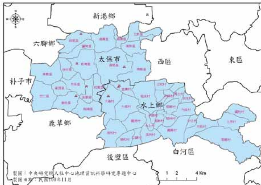
▲圖 6. 嘉義水上太保地區五年千歲迎王寺廟示意圖

嘉義與雲林交接地區其迎請代天巡狩，部分廟宇會迎請南巡與北巡王爺，南巡王爺為南鯤鯓代天府五府千歲，北巡王爺為馬鳴山鎮安宮五年千歲。例如海邊區域的東石鰲鼓，或是水上塗溝村都會特別分別恭請南北代巡，也分別設置南北代巡的祭祀象徵。