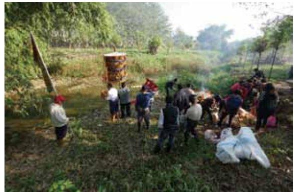
▲圖 8. 太保魚寮保安宮送王 Figure 8. Bidding the kings farewell conducted by Baoan Temple, Yuliao, Taibao.