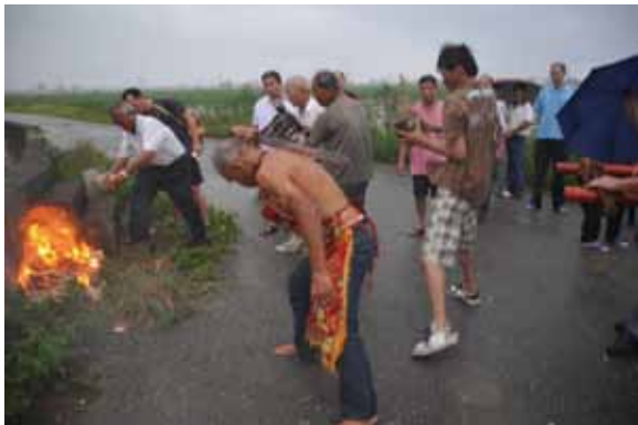
▲圖 4 中洲金福安壇送王

Figure 3. Welcoming the kings performed by Youtian Temple, Shangliao, Dongshi.