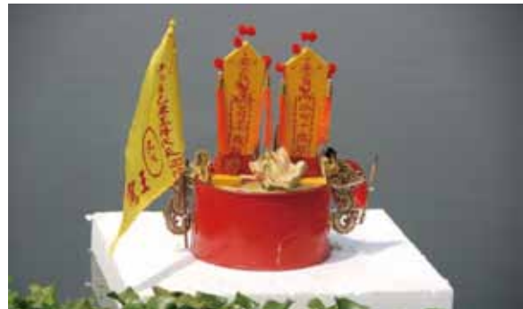
▲圖 29. 屏東市鎮溪宮送王（王爐）

Figure 29. Bidding the kings farewell conducted by Zhenxi Temple, Pingtung City (the kings' furnace).