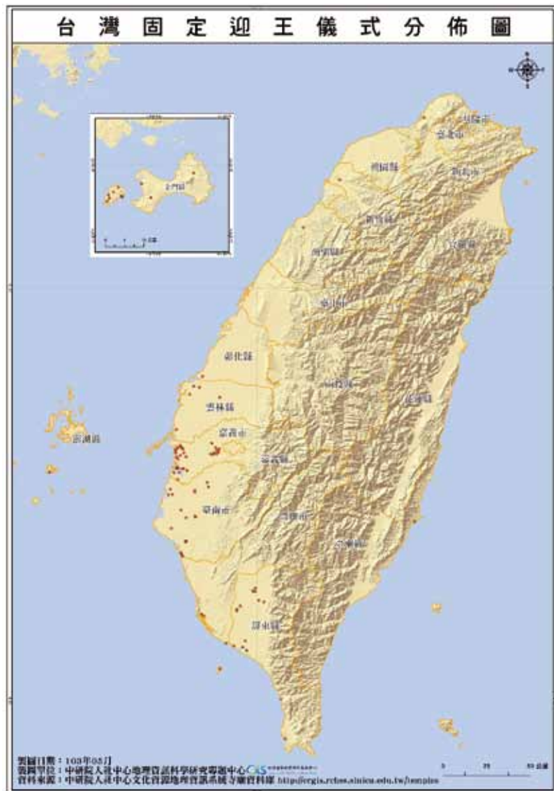
▲圖 1. 臺灣定期迎王寺廟示意圖