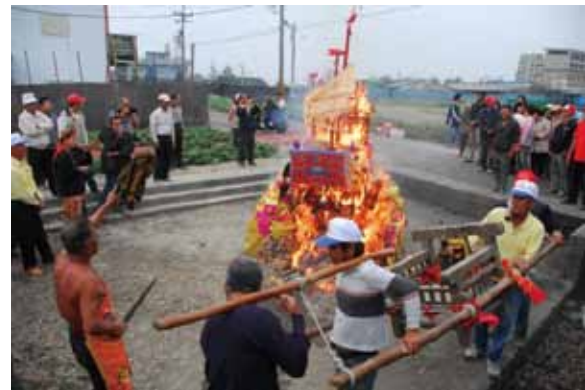
▲圖 13. 北門溪底寮東興宮送王