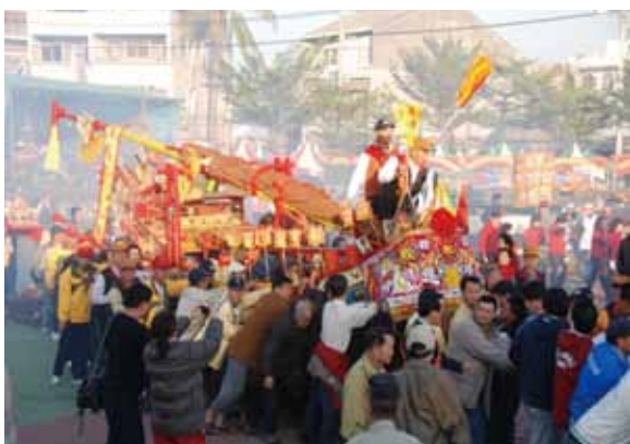
▲圖 18. 灣裡萬年殿王船出巡