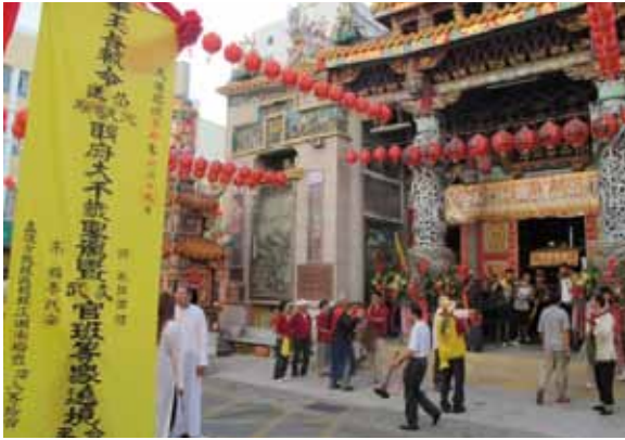
▲圖 24. 鹽埕三山國廟送王

Figure 24. Bidding the kings farewell conducted by Sanshan Guowang Temple, Yancheng.