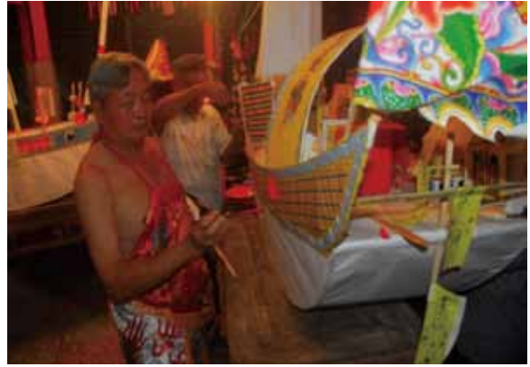
▲圖 40. 金門後浦頭慈德宮王船點睛

Figure 40. Dotting the eyes of the kings' boat conducted by Cide Temple, Houputou, Kinmen.