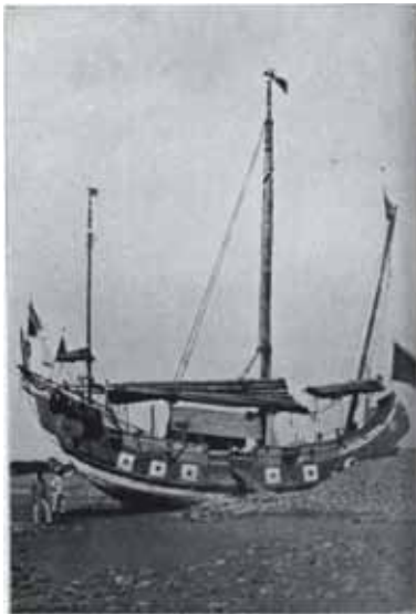
▲圖 31. 漂來王船

下圖是日治時期在苗栗後龍撿拾到中國大陸沿海所漂來的王船紀錄，當時日本警察還登上王船檢查，做成詳細的紀錄，這項完整記錄，讓我們更了解閩南王船「游地河」的傳統，而這艘船上的神明與相關物品也奉祀於後龍外埔合興宮內。而合興宮其於 2007、2011 年各辦理過一次迎送代天巡狩的「四、七府王爺建造王船慶典」儀式 74 ，依據田野調查，其廟內神明指示還要辦理一次，3 次才得以完科，後續還需依神明指示。竹北大眉南天府奉王爺指示辦理王醮，因為搬遷等