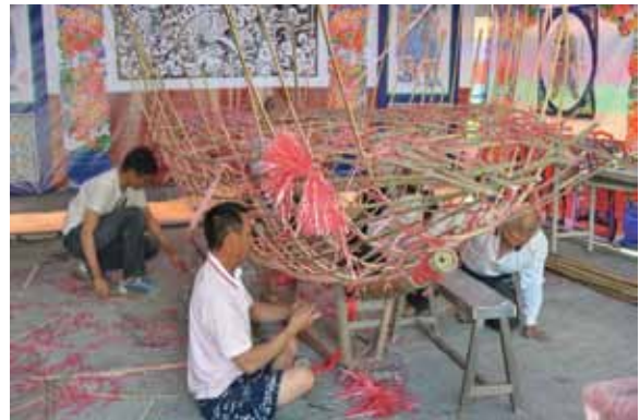
▲圖 5 網寮鎮安宮綁製王船

Figure 4. Bidding the kings farewell conducted by Fuan Altar, Zhongzhou.