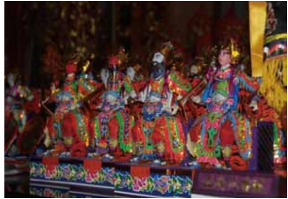
▲圖 23. 茄荳三清宮所請之 36 進士

Figure 23. The 36 imperial scholars invited by Sanqing Temple, Jiading.