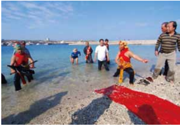
▲圖 37. 桶盤福海宮請王 Figure 37. Bidding the kings farewell conducted by Fuhai Temple, Tongpan.