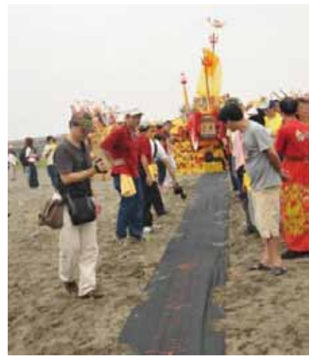
▲圖 15 保玉宮送王

Figure 15. Bidding the kings farewell conducted by Baoyu Temple.