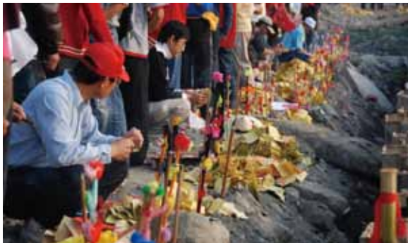
▲圖 28. 新圍慈天宮請王

Figure 28. Bidding the kings farewell conducted by Citian Temple, Xinwei.